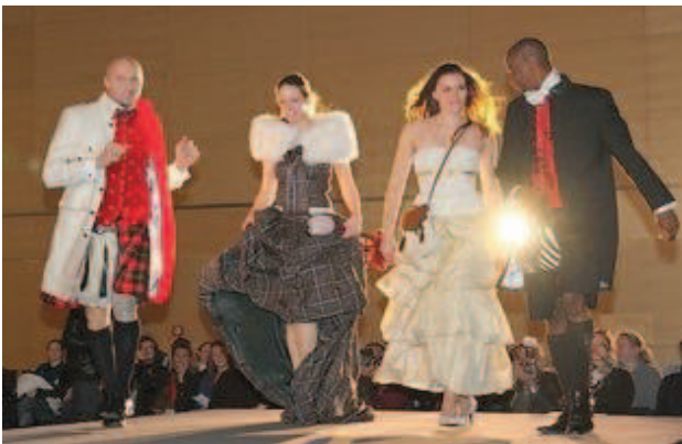
BILD zu OTS - Österreichs größte Hochzeitsmesse