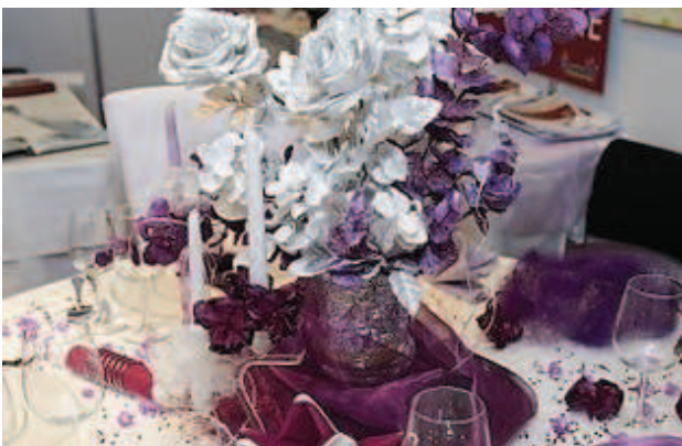
BILD zu OTS - Österreichs größte Hochzeitsmesse