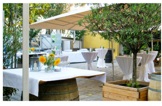
Garten im Weingut